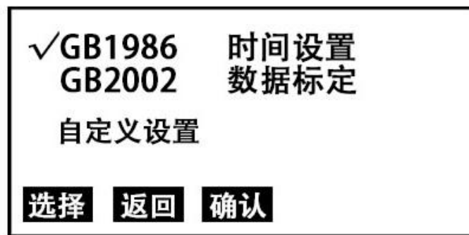
图 2 选择子页面