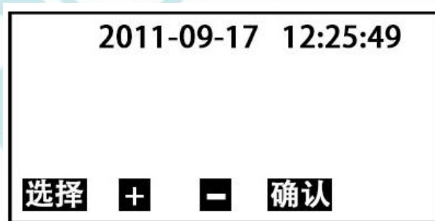
图4 时间设置子页面

5. 在图2页面下，按选择键移动光标√至时间设置处，按确认键即可进入时间设置子页面(图4)。