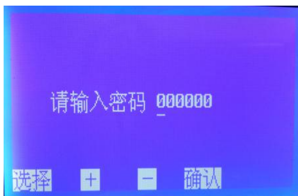
图 6 数据标定子界面

注意：设备出厂前数据已由厂家标定好，用户不需要进入程序标定，如需要标定数据，请与生产厂家联系索要密码进行标定。