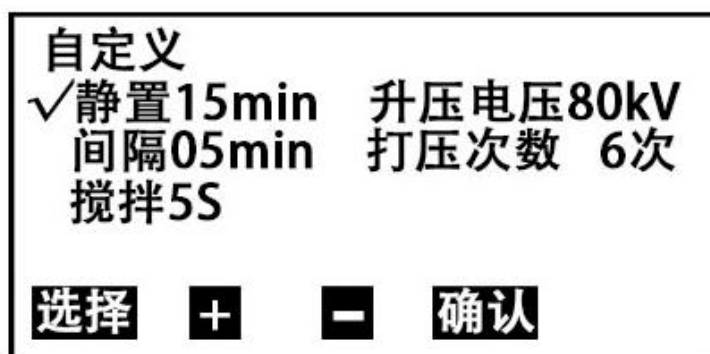
图 5 自定义设置子页面

在图 5 页面下，按 选择 键移动光标到相应的选项，再按 + 或 - 键可进行相关参数的设置。其中：