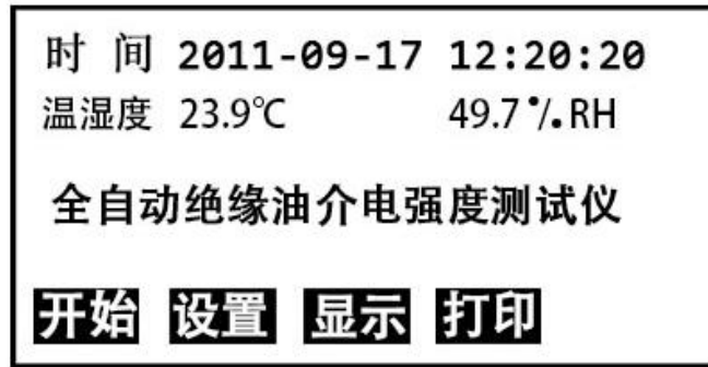
图 1 开机页面