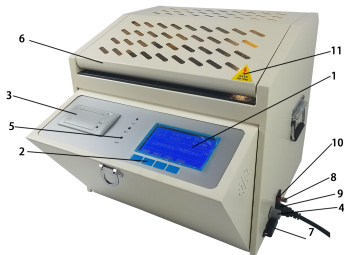
PS-1001 绝缘油介电强度测试仪