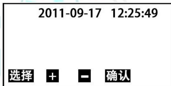
图4 时间设置子页面

5. 在图2页面下，按 选择 键移动光标 \checkmark 至 时间设置 处，按 确认 键即可进入 时间设置 子页面(图4)。