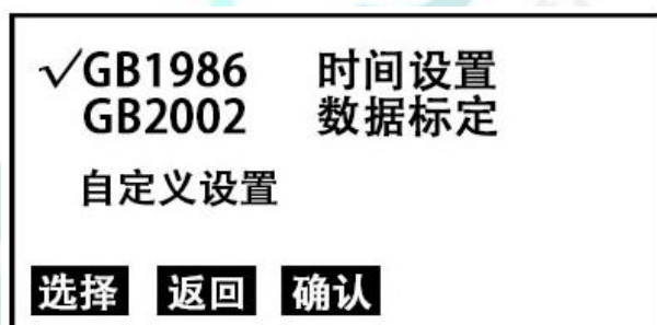
图 2 选择子页面