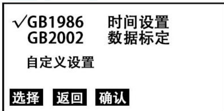
图 2 选择子页面