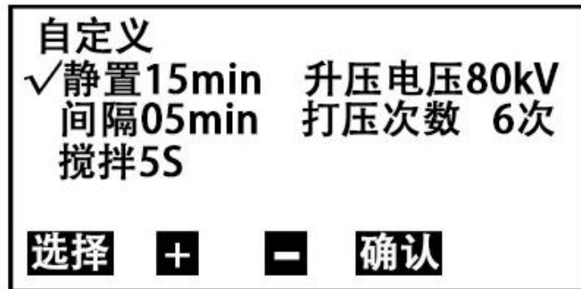
图 5 自定义设置子页面

在图 5 页面下，按 选择 键移动光标到相应的选项，再按 + 或 - 键可进行相关参数的设置。其中：