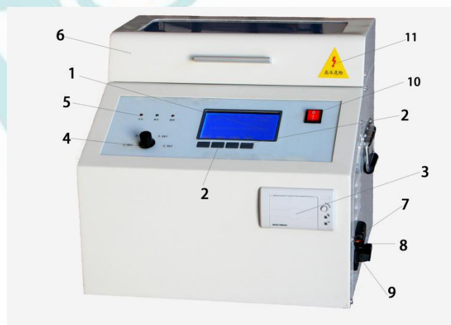
PS-1001 绝缘油介电强度测试仪